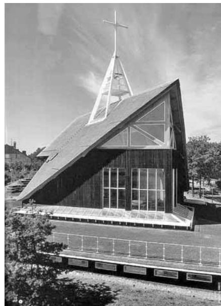
13 pav. Marijos Krikščionių Globėjos bažnyčia (arch.: A. Zaviša, R. Krištapavičius. Konstruktorius: T. Tubis). Nida, 2002 m.

Ypatingu jautrumu aplinkai ir humaniškumu spinduliuojanti Marijos Krikščionių Globėjos bažnyčia Nidoje (arch.: A. Zaviša, R. Krištapavičius. Konstruktorius: T. Tubis, 2002 m. (13 pav.)) yra vienas ryškiausių Lietuvos šiuolaikinės sakralinės architektūros perlų. Priešingai nei prieš tai aptartas pavyzdys, ši bažnyčia pasižymi vietinės architektūros tradicijų tęstinumu ir subtilia jų interpretacija. Bažnyčios architektūra – unikali, turinti ryškių, nors anaipol netiesmukų, regionališkumo užuominų. Nendrėmis dengtas stogas, medinė apdaila bei išorės siluetas tiesiog alsuoja pamario kraštui būdingos senosios architektūros dvasia (Buivydas 2002: 96). Reikšmingiausiais šios šventovės bruožais galime laikyti saikingą ir subtilų senųjų religinių ir pamario krašto simbolių kodavimą, tradicinių medžiagų pritaikymą šiuolaikiniu pavidalu ir, be abejonės, architektūros jautrumą aplinkos atžvilgiu.