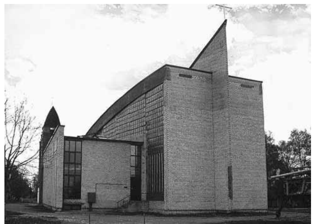
6 pav. Šv. Kryžiaus bažnyčia (arch.: V. Kuliešius, G. Narkevičius). Pagėgiai, 1993 m.

Charakterizuojant šį laikotarpį, pravartu paminėti tiek gerus, tiek ir ne tokius sėkmingus naujosios sakralinės architektūros pavyzdžius. Negatyvius rezultatus lėmė daug priežasčių, svarbiausia tai, kad anuomet nebūta architektų, kurie turėtų patirties kuriant kulto pastatus. Be to, veikė daug socialinių, ekonominių bei kultūrinių veiksnių. Kadangi trūko lėšų, kai kurios bažnyčios būdavo įkurdinamos tam nepritaikytuose pastatuose, o statant naujas bažnyčias ne visi architektai įvertindavo tradicijų, religinės simbolikos ir vietovės konteksto svarbą. Todėl perdėti lūkesčiai bei ambicijos dažnai virsdavo gigantiškais statiniais, užkraunančiais statybų našta net ir nedidelėms religinėms bendruomenėms. Tai iliustruoja keletas pavyzdžių: Pagėgių Šv. Kryžiaus bažnyčia (arch.: V. Kuliešius, G. Narkevičius, 1993 m. (6 pav.)), Šiaulių Švč. Mergelės Marijos Nekalto Prasidėjimo bažnyčia (laikina įrengta buvusiuose kultūros rūmuose (7 pav.)), Lietuvos Kankinių bažnyčia Domeikavoje (arch.: K. Pempė, R. Mulokas, K. Kisielius, A. Asauskas ir G. Ramunis, 1993–2006 m. (8 pav.)), Kauno Gerojo Ganytojo parapijos bažnyčia (arch.: A. Kučas ir M. Preissas, 1999 m. (9 pav.)) ir daugybė kitų.