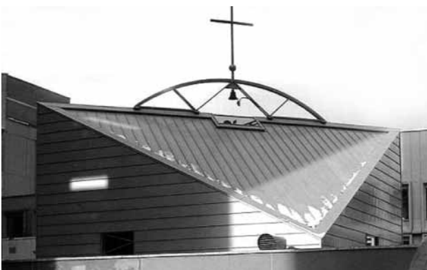
12 pav. Santariškių klinikų Dievo gailestingumo koplyčia (arch.: K. Pempė, A. Pliučas). Vilnius, 2001 m.

Tarp vertingiausių Lietuvos šiuolaikinės sakralinės architektūros pavyzdžių galima paminėti ir Respublikinės Santariškių ligoninės koplyčią (arch.: K. Pempė, A. Pliučas, 2001 m. (12 pav.)). Čia autoriai varijuodami nepretenzingų formų, lakoniškų architektūrinių ženklų temas pasiekė, kad tiek tūrinė koplyčios plastika, tiek fasadų grafikos modeliuotė tapo neatskiriama, organiška esamo konteksto dalimi. Eksterjero raiškos subtilumą, precizišką architektų požiūrį į nuoseklų ir kompleksinę situacijos humanizavimą pabrėžia