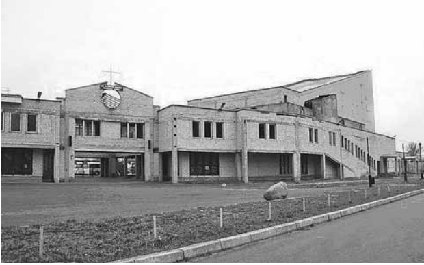
7 pav. Švč. Mergelės Marijos Nekalto Prasidėjimo bažnyčia (laikiniai įrengta buvusiuose kultūros rūmuose). Šiauliai