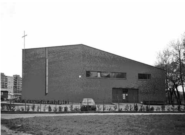
9 pav. Gerojo Ganytojo parapijos bažnyčia (arch.: A. Kučas ir M. Preisas). Kaunas, 1999 m.