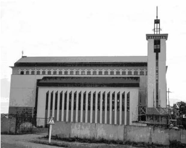
8 pav. Lietuvos Kankinių bažnyčia (arch.: K. Pempė, R. Mulokas, K. Kisielius, A. Asauskas ir G. Ramunis). Domeikava, 1993–2006 m.